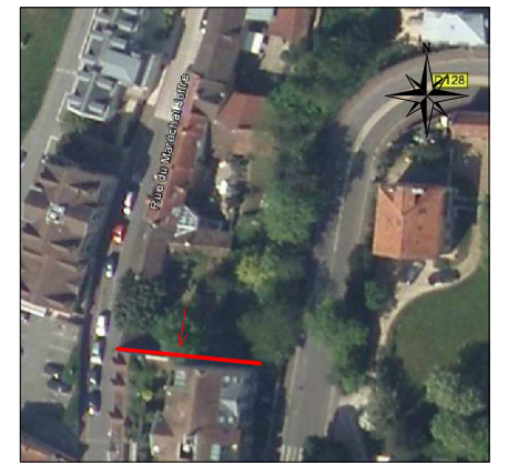
Vue aérienne (sans échelle)